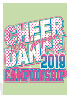
*Front-mark* 蛍光ピンクとターコイズ ホワイトの3色

● 吸水性に優れたポリエステルメッシュで汗をかいてもサラサラ！ ● 普段のレッスンや夏の暑い日でも快適に着られる T シャツです！